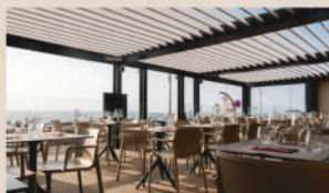
Le Café Maritime