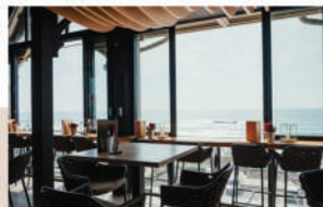
Le Bar Panoramique