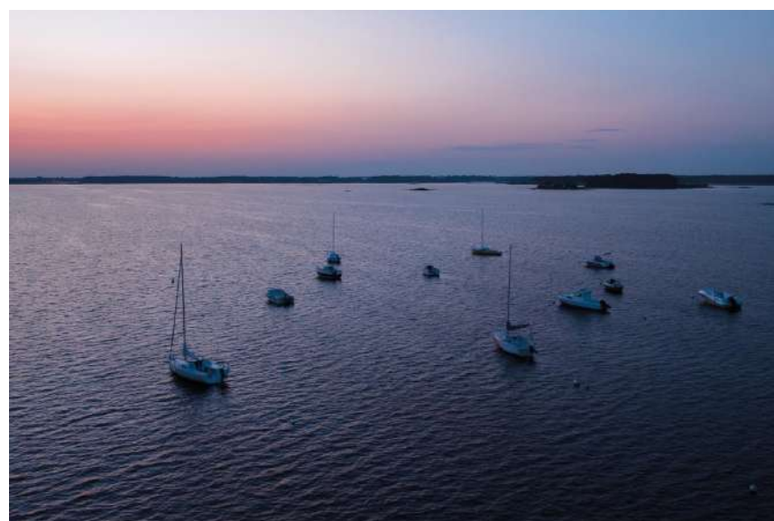
Lac de Lacanau

Du côté de Carreyre, on profite du calme, rythmé par le clapotis des bateaux et le ballet des cygnes glissant sur l'eau, avec en toile de fond, la Réserve Biologique Dirigée de Vire Vieille complète ce panorama privilégié.