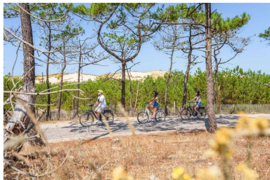
Boucle du Lion