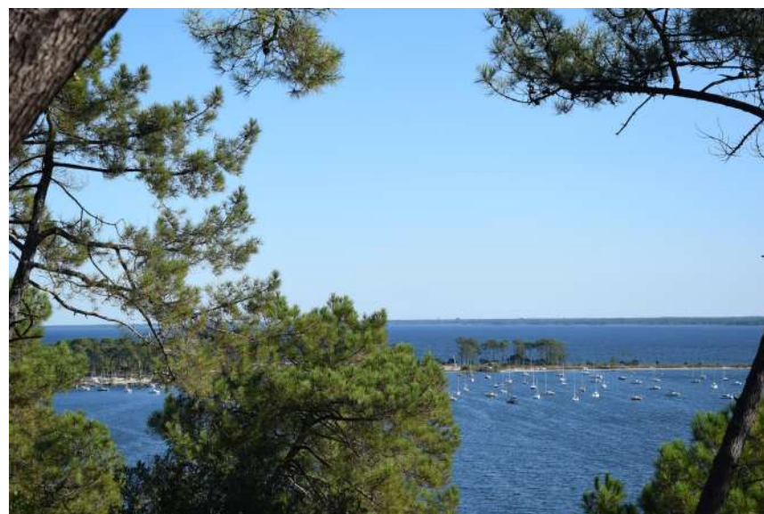
Sentier du Lac

À Lacanau, la boucle du Lion (18 km) offre une sortie vélo facile, idéale en famille. L'itinéraire, traversant la forêt, permet d'atteindre la pointe de Bernos pour une vue exceptionnelle sur l'île aux Oiseaux et les rives du lac de Lacanau.