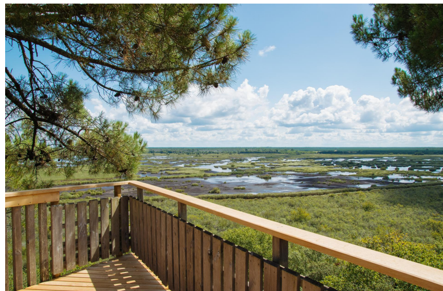
Réserve Naturelle de l'étang de Cousseau

Pour la Réserve de Hourtin, l'accès se fait en voiture et les visites s'effectuent à pied.