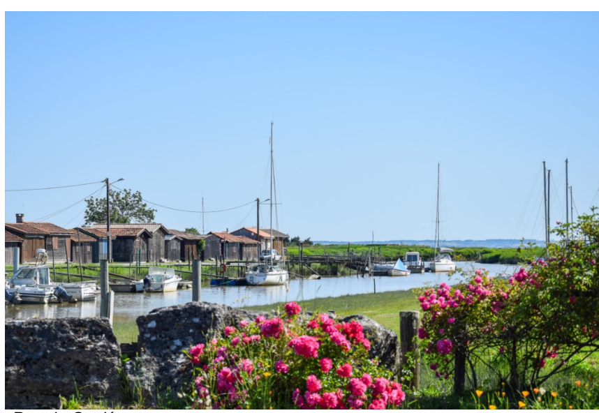
Port de Goulée