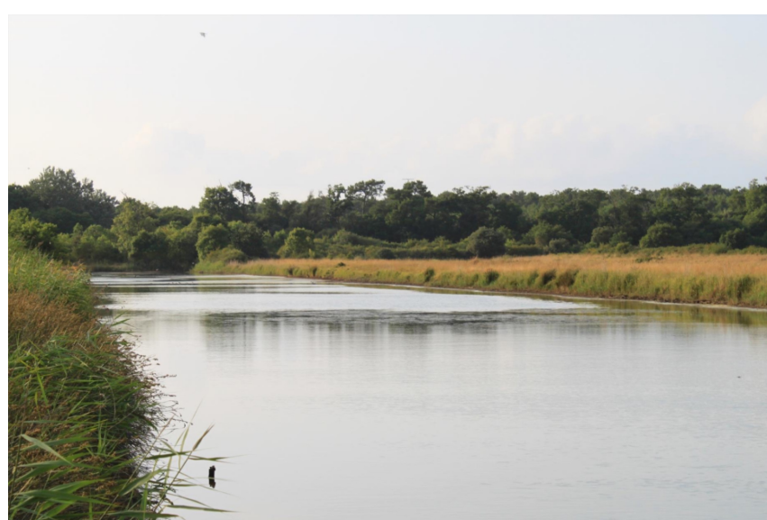
Marais du Logit