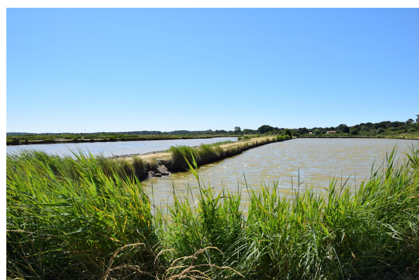
Marais du Conseiller

Ces sites ne sont que quelques exemples. Le territoire en compte d'autres, comme la Réserve biologique dirigée de Vire Vieille, Vignotte et Batejin , qui poursuivent tous la même vocation : allier protection des espaces et ouverture au public pour profiter de la nature et sensibiliser aux enjeux de préservation .