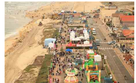
Les organisateurs annoncent le départ et l'arrivée de la course sur le front de mer de la station balnéaire.

roulant mais pas totalement plat, avec un peu plus de 80 mètres de dénivelé. Les organisateurs lancent aussi un appel aux bénévoles. Il en faudra une centaine pour sécuriser et encadrer l'épreuve. Les inscriptions et les informations pratiques sont à retrouver sur le site de la course, désormais en ligne. Premiers arrivés, premiers servis.