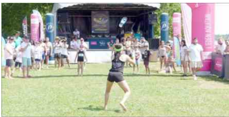
Le championnat du monde de lancer de tong, renommé Tong Masters l'année dernière, va quitter Lacanau .

LITIGE. Après trois éditions au Moutchic, la célèbre compétition de lancer de tongs en équipe ne se déroulera pas à Lacanau cette année. L'organisateur historique, l'association Lac, doit trouver un nouveau point de chute pour organiser son célèbre championnat du monde.