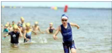
Le Médoc Atlantique Frenchman Triathlon est aussi un événement familial.

Le Frenchkid aquathlon, suivi des distances M (1 500 m natation, 40 km vélo, 10 km course à pied) et XS (400 m natation, 10 km vélo, 2, 5 km course à pied) ont ouvert le festival de triathlons, les 13 et 14 mai à Carcans-Maubuisson. Place aux « gros morceaux » du Médoc Atlantique Frenchman Triathlon.