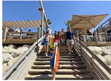
Le beau temps durant ces vacances de Pâques a incité les Bordelais et les locaux à venir à la plage.