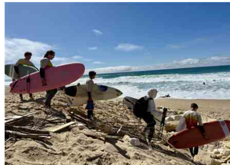
Le beau temps durant ces vacances de Pâques a incité les Bordelais et les locaux à venir à la plage.