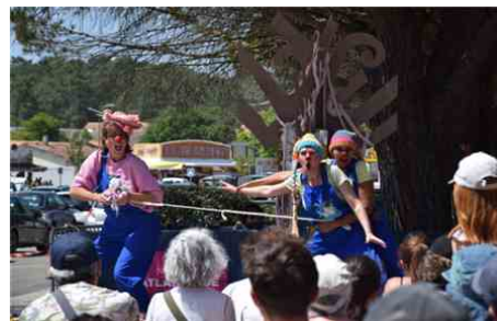
La représentation de « Grog'lan » sur la scène du lac.

En ce week-end prolongé et largement ensoleillé, la station de Maubuisson était particulièrement fréquentée. Au traditionnel public composé des amateurs de théâtre s'ajoutaient les visiteurs de passage qui ont découvert le festival et se sont pris au jeu, alternant plage et spectacles.