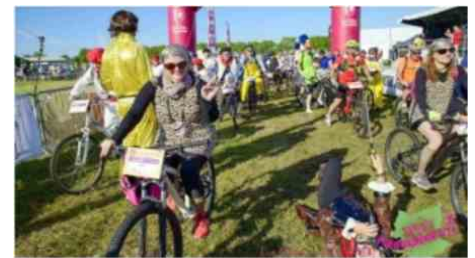
7 250 vététistes sont attendus lors de la Médocaine VTT 2026.