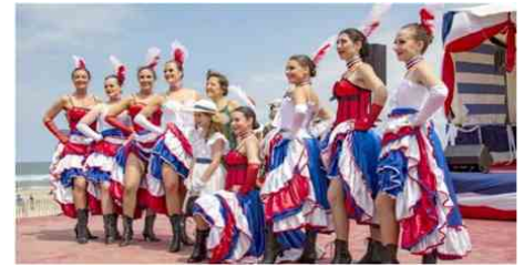
Danses sur le front de mer, déambulations artistiques dans les rues... Toute la station balnéaire est en fête durant le week-end de Soulac 1900.