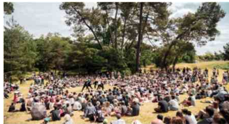
Dans le parc Fongravey de Blanquefort, le festival Echappée Belle met à l'honneur le spectacle vivant.

cette dimension. Autre pilier de l'événement : son ancrage local et associatif. Le Village des associations, animé par l'ABCS et grâce à la participation des bénévoles de quatorze structures blanquefortaises, proposera des espaces de restauration dans une démarche écoresponsable, fidèle aux valeurs portées par le festival. Enfin, Échappée Belle confirme porter une grande attention au jeune public. Une journée spécifique, vendredi 29 mai, devrait rassembler près de 3 000 enfants autour de spectacles et d'ateliers de découverte des arts vivants, mais aussi de la faune et de la flore du parc. Le festival entend une nouvelle fois conjuguer culture et proximité, dans un cadre naturel propice à la rencontre.