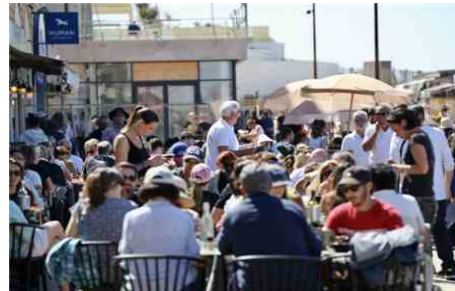
Le beau temps durant ces vacances de Pâques a incité les Bordelais et les locaux à venir à la plage.