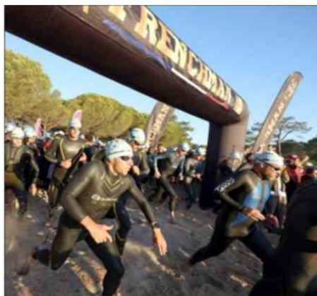
Près de 8 000 participants sont attendus sur les différentes épreuves du Médoc Atlantique Frenchman Triathlon.