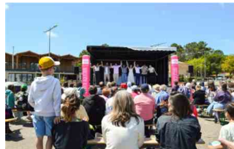
Le Festival du Court théâtre, sur la place principale de Maubuisson, attire un public familial. Médoc Atlantique

d'objet. Toutes les formes sont les bienvenues, à condition de pouvoir être jouées aussi bien en intérieur qu'en extérieur. Les troupes pourront proposer des pièces, des extraits ou des maquettes. Entièrement gratuit, le festival entend faire de Carcans-Maubuisson un lieu de rencontre entre passionnés de théâtre, artistes en devenir et grand public. Une sortie originale à partager en famille.