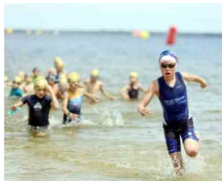
Le Médoc Atlantique Frenchman Triathlon est un événement familial.