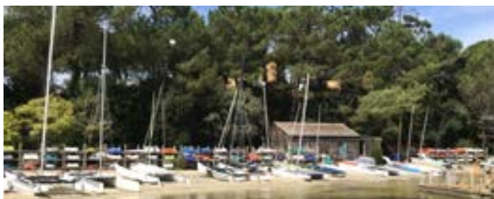
Le Monde de Maya - 21 mars : Un week-end à la plage : Carcans et Hourtin