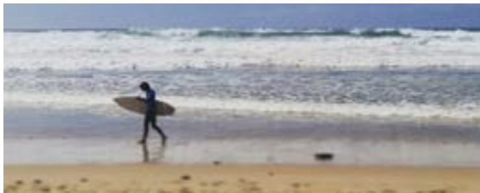
Facebook - Solcito - 25 février : 6 activités pour découvrir Lacanau autrement (Engagement : 6 «j'aime» et 1 partage)