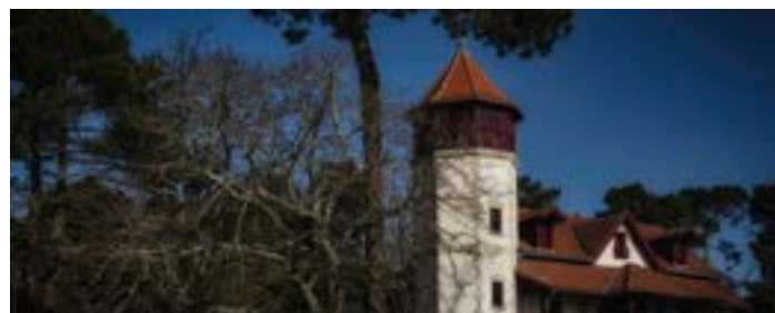
Coblog - 5 mars : La belle maison du commandant au Moutchic