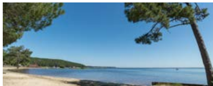
1duvetpour2 - 21 mars : Que faire à Lacanau au printemps ? (Engagement : 15 «j'aime» et 3 commentaires)