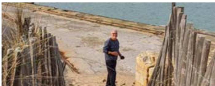
Facebook - Les Epicurieux.eu - 28 février : Nous voici de retour au bord de l'Atlantique (Engagement : 13 «j'aime», 4 commentaires, 1 partage)