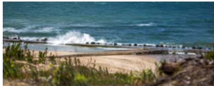
Facebook - Département de la Gironde - 27 février : Envie de profiter de ce superbe temps ? (Engagement : 23 «j'aime» et 6 partages)