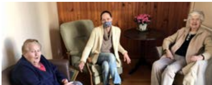
Les Socios de L'AS Saint Etienne - 9 mars : Saint-Vivien-de-Médoc : la maison en colocation pour séniors