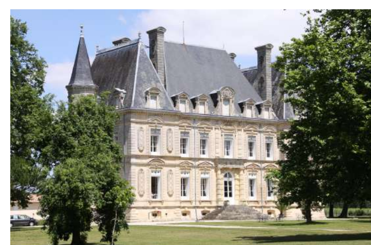
TABLE D'HÔTES AU CHÂTEAU ROUSSEAU DE SIPIAN

Dominant l'estuaire de la Gironde, le Château Rousseau de Sipian à Valeyrac ouvre les portes de sa table d'hôtes.