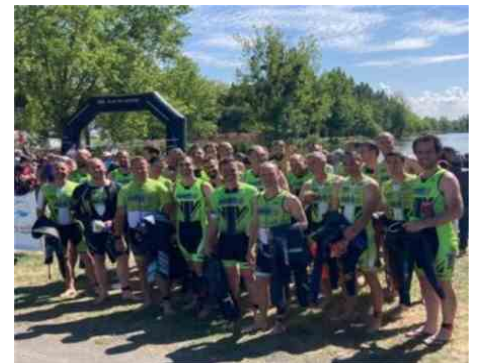
Au triathlon 2022 de Thouars, ils étaient plus de cinquante, sur la ligne de départ, à porter le dossard du Saumur Team Triathlon.

Par ailleurs, le Swimrun sera reconduit en juin, en partenariat avec l'Agglomération Saumur Val de Loire, à la piscine Val-de-Thouet. Renseignements au 06 77 76 62 87 ou saumurteamtriathlon@gmail.com