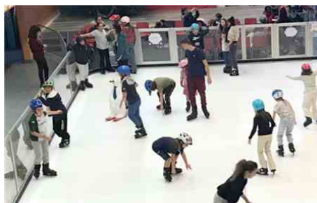
Une patinoire synthétique est disponible durant les vacances scolaires.

de 16h à 18h. Un concert gratuit est aussi au programme. L'Université Musicale Hourtin Médoc (UMHM) organise, à 17h30, un concert gratuit à l'église Sainte-Hélène, avec les Polyphonies d'Eysines, fortes de 70 choristes.