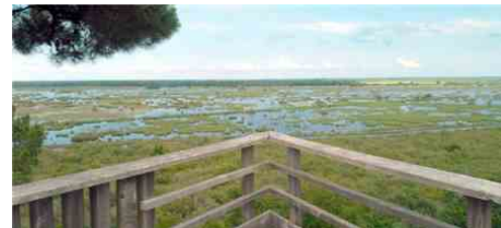
Un observatoire idéal pour assister au spectacle des grues cendrées.

le marais à la nuit tombée. Les gardes répondront aux questions, avec des outils pédagogiques adaptés aux petits comme aux grands. Des jumelles et des longues-vues seront mises à disposition pour mieux voir ces oiseaux à la nuit tombée. Il est bien sûr conseillé de bien se couvrir, de prendre un thermos de thé ou café chaud. Une lampe sera nécessaire pour le retour en pleine nuit. Les gardes donnent rendez-vous au point de vue de la réserve, accessible en suivant les panneaux jaunes, depuis le parking de départ.